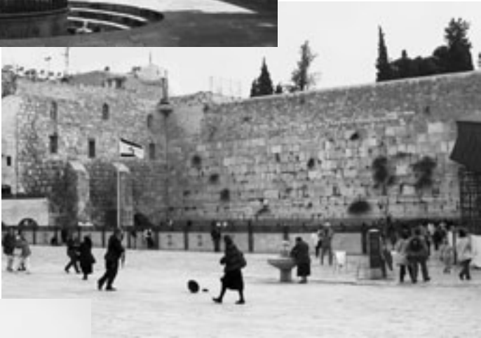
Klagemauer in Jerusalem