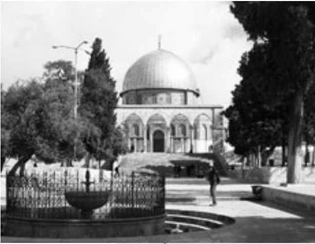
Felsendom in Jerusalem